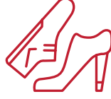
Ayakkabı, çanta ve deri