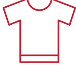
Tekstil ve giyim

UL Türkiye'nin tekstil ve giyim uzmanları, prototip çalışmaları sırasında ve üretim öncesi aşamalarda tasarımın güvenlik, kalite ve sürdürülebilirlik bakımından en yüksek standartlara uyup uymadığını değerlendirebilmektedir.